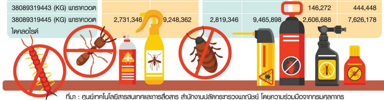
ที่มา : ศูนย์เทคโนโลยีสารสนเทศและการสื่อสาร สำนักงานปลัดกระทรวงพาณิชย์ โดยความร่วมมือจากกรมศุลกากร